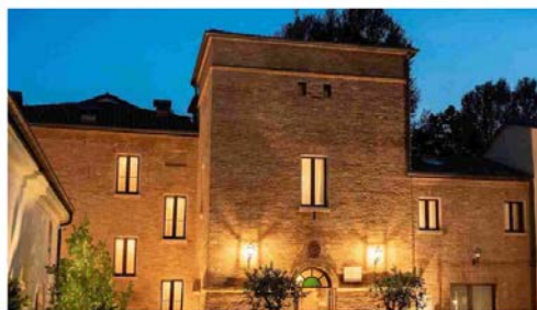
"Così Villa La Personalà è tornata a splendere"

Mirandola, dopo il sisma l'edificio è stato restaurato con l'aiuto del gruppo Iris .