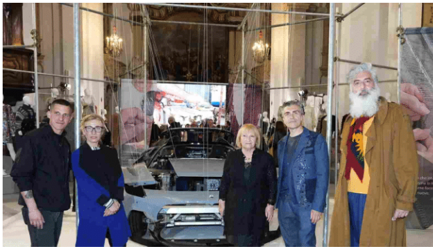
Motor Valley Fest al via La moda sposa i motori e mette in mostra 'pezzi

Fino al 25 giugno nella chiesa di San Carlo c'è 'Manualmente', l'esposizione promossa da Modenamoremio con Modateca Deanna.