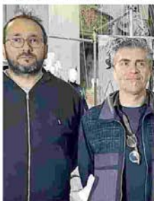
Carafoli e Bugani: «In esposizione pezzi unici dai mondi di moda, ceramica e motori»

Iris Ceramica Group è tra i protagonisti dell'esposizione che vede la ceramica interpretata da diverse mani in molteplici forme e linee. E se i motori, del Motor Valley Fest, si inseriscono nel percorso espositivo ideato dall'art director Paolo Bazzani attraverso l'esposi-