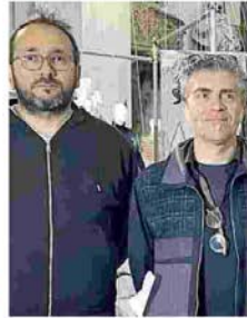
Carafoli e Bugani: «In esposizione pezzi unici dai mondi di moda, ceramica e motori»

Iris Ceramica Group è tra i protagonisti dell'esposizione che vede la ceramica interpretata da diverse mani in molteplici forme e linee. E se i motori, del Motor Valley Fest, si inseriscono nel percorso espositivo ideato dall'art director Paolo Bazzani attraverso l'esposi-