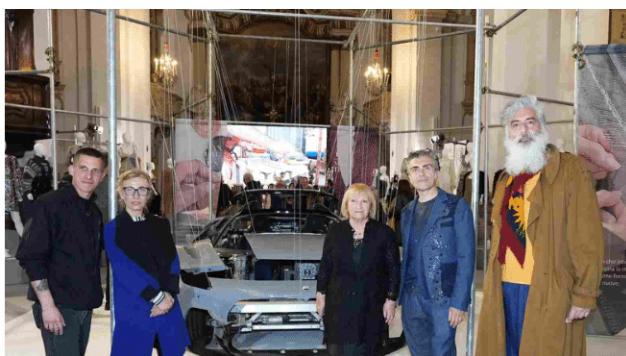
Motor Valley Fest al via La moda sposa i motori e mette in mostra 'pezzi

Fino al 25 giugno nella chiesa di San Carlo c'è 'Manualmente', l'esposizione promossa da Modenamoremio con Modateca Deanna.