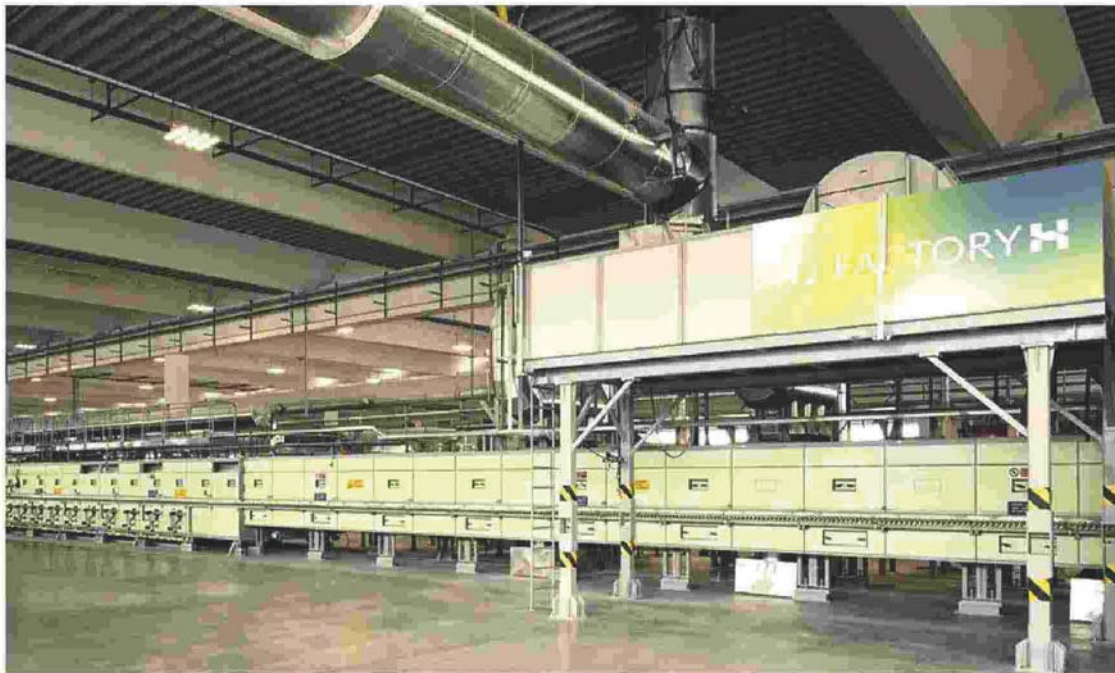
Made in Italy e transizione. Verso la produzione a idrogeno nelle fabbriche di Iris Ceramica