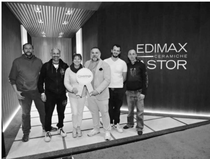
EDIMAX ASTOR CERAMICHE