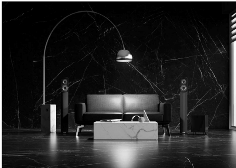
New controls can operate lighting and other systems via porcelain wall slabs and countertop ... [+] IRIS CERAMICA GROUP