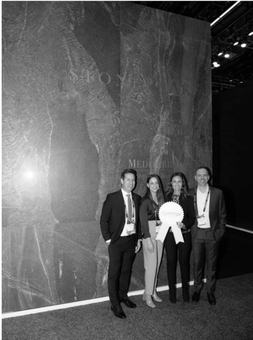
Iris Ceramica Group

EDIMAX ASTOR CERAMICHE's vast array of inspired displays included Symphony and Nuances porcelain ceramic tile collections, offered in small, medium and large-scale formats. The theme of EDIMAX ASTOR CERAMICHE's booth display represented the modern luxury of residential building, drawing its inspiration from linear and modern architecture with monumental and sometimes sculptural forms. Coverings 2023 attendees touring the booth had an eye-opening experience that reminded them of the diversity of tile and its multitude of applications.