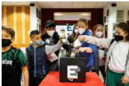
Si comincia con un viaggio nella realtà virtuale, in