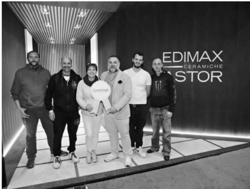
EDIMAX ASTOR CERAMICHE