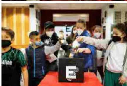
Si comincia con un viaggio nella realtà virtuale, in