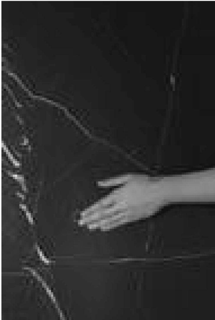
Client can opt for a subtle surface marking letting users know where the control is located. IRIS CERAMICA GROUP